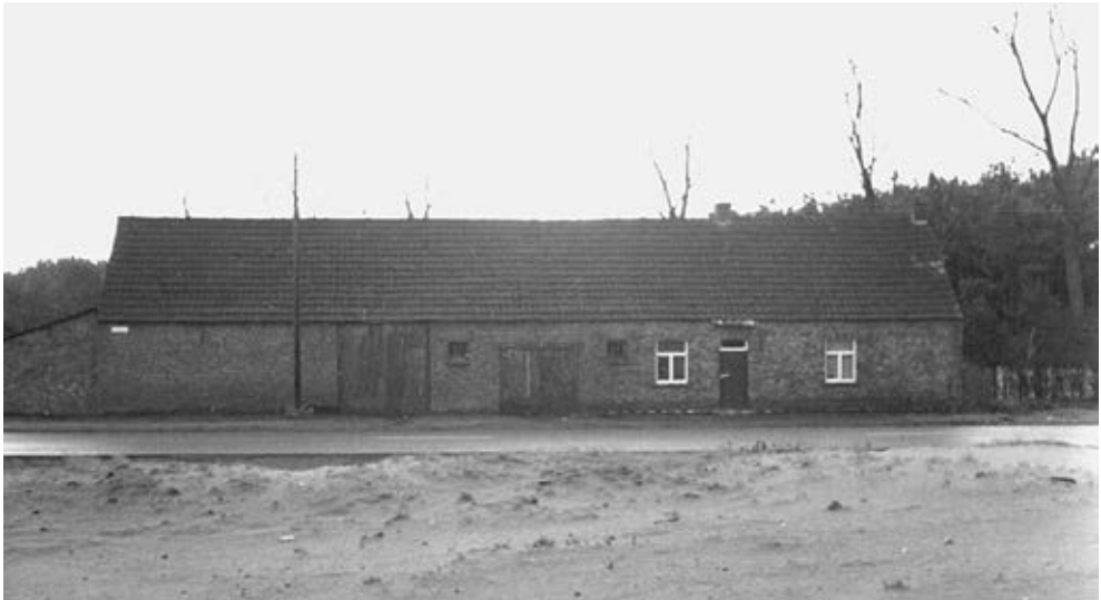
De Ruif (nu taverne De Wascuyl).