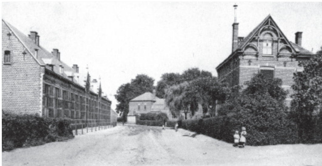
Foto 3: De Boulevard vanaf de Nieuwstraat, met rechts de villa Van Dingenen (nadien Kemps) en links de nieuwe jongensschool.