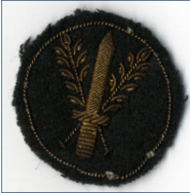
Foto 1-1: Embleem van de Boerenwacht: een zwaard met twee rijpe korenaren. Symbolisch gekozen ter bescherming van de oogst.