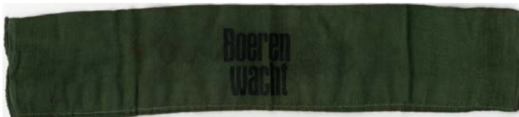
Foto 1-3: Voorbeeld van een armband van de vrijwillige boerenwacht. Donkergroene band met zwarte letters.

“Artikel I: Het bewaken van de veestapel, landeigendommen, veldvruchten en vruchten van de grond waar deze zich ook mochten bevinden. De leiding hiervan werd toevertrouwd aan het NLVC.”