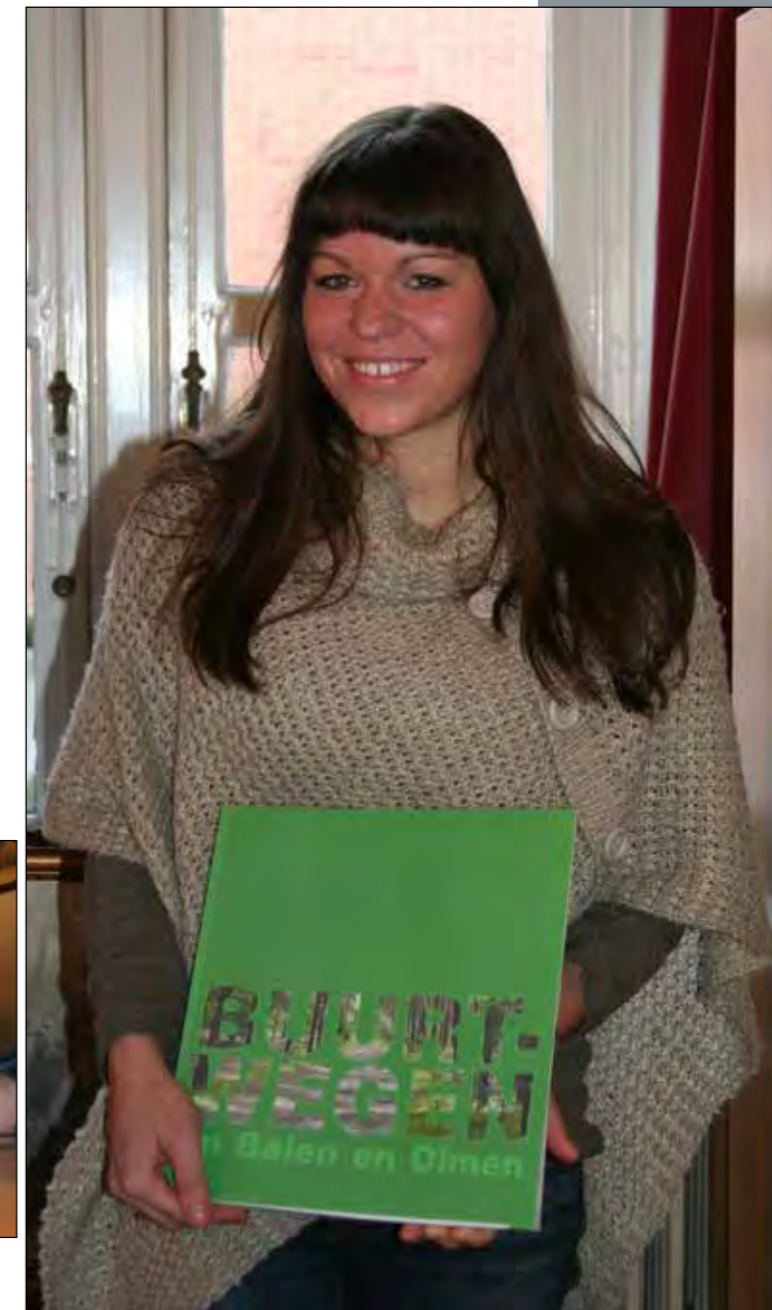
Auteur Annelies Delnooz.