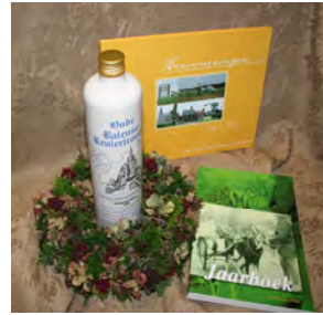
Geef een stukje Balen cadeau

“Ons erfgoed bevat een schat aan informatie”