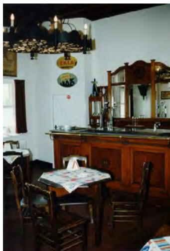
Foto: herberg van vroeger, te bezichtigen in het Oud Gemeentehuis

Om constructief aan Erfgoedbeheer te doen is er nood aan geëngageerde personen vanuit de Balense (Olmense) bevolking.