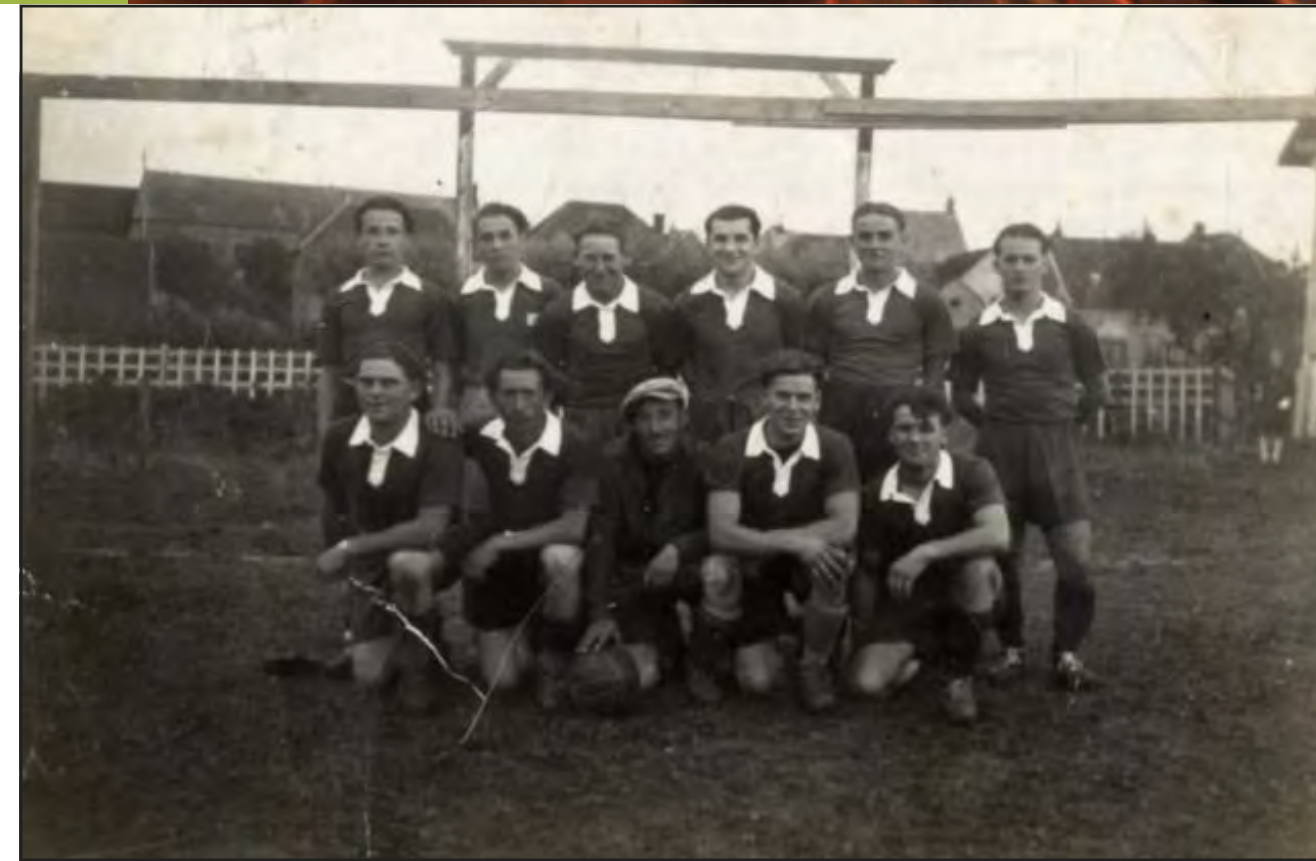
Herken je de voetballers op deze foto. Laat het ons weten via e-mail of ons secretariaat.

Onbekend is ... verloren voor het nageslacht